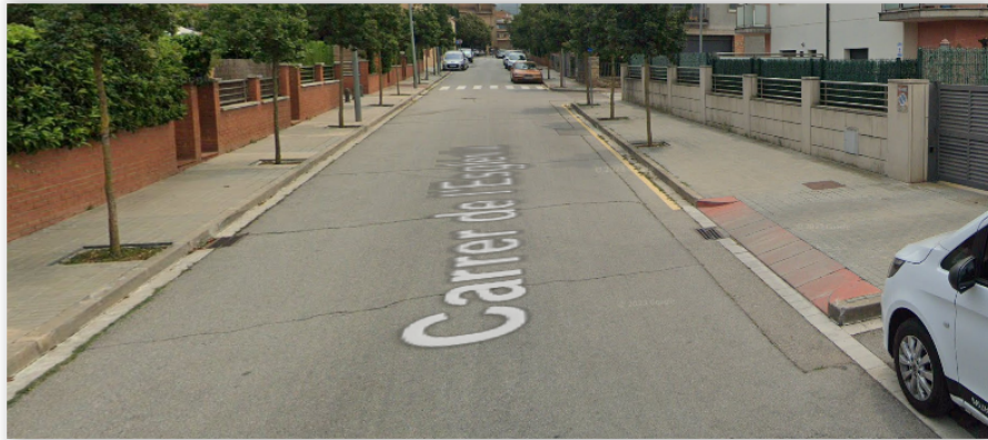
Vista a la zona a on es demana que no s'estacioni

L'amplada d'un vial d'uns 6 m. com aquest, pot permetre de manera correcta el doble sentit de circulació, sempre que no s'estacionin vehicles als costats, o bé un únic sentit de circulació si només es permet l'estacionament en un dels costats, a excepció en aquest cas del tram on els estacionaments es troben reculats i es podria estacionar a cada costat mentre no es comencin a edificar aquests solars, ja que en caldrà permetre l'accés amb vehicle als nous habitatges.